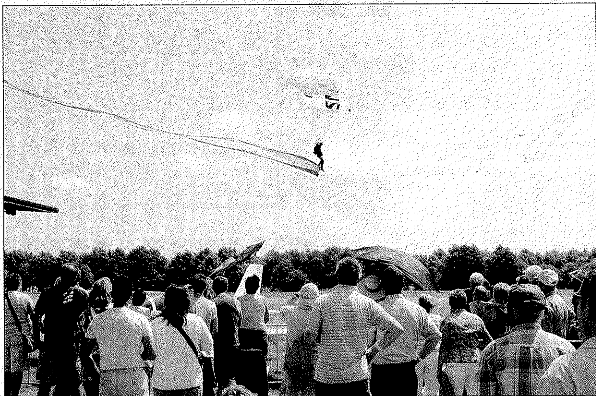
Het publiek bewondert de parachutisten die precieze en correcte landingen maakten.

BOSSCHENHOOFD - Afgelopen weekend vierde Vliegveld Seppe haar 60-jarige jubileum en het 100-jarig bestaan van de luchtvaart in Nederland. Op vrijdag was er een kleurig luchtballonnenfiësta, waarbij 11 luchtballonnen de lucht ingingen. Na het muzikfeest, werd een bioscoopfilm vertoond in de buitenlucht. Op zaterdag vond een indrukwekkende airshow plaats. Ingevoerde figuren en spectaculaire capriolen (aerobatics geheten) werden uitgevoerd in de lucht. Toeschouwers stonden ademloos te kijken naar de Blades, Britse luchtmachters die met hun toestellen vlak langs elkaar heen scheerden en loopings maakten. Een buitenkansje voor vliegtuigspotters dus. Maar ook voor de minder grote experts en vliegtuighobbyisten was er genoeg te zien en te doen. Enige minpuntje was dat het parkeerbeleid zaterdag leidde tot irritatie en dat het verkeer, ondanks de verkeersregelaars, vast kwam te staan.