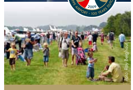
Seppe Airshow 2009

Samen met andere partijen organiseerden we de ‘Seppe Airshow 2009’, een groot succes. Met de ballonfiesta, de statische ‘100-jaar-luchtvaart’ opstelling en de air display lieten we zien hoe leuk luchtvaart kan zijn. Dit jaar herhalen we het festijn nog een keer, in samenwerking met de Technische Universiteit Delft.