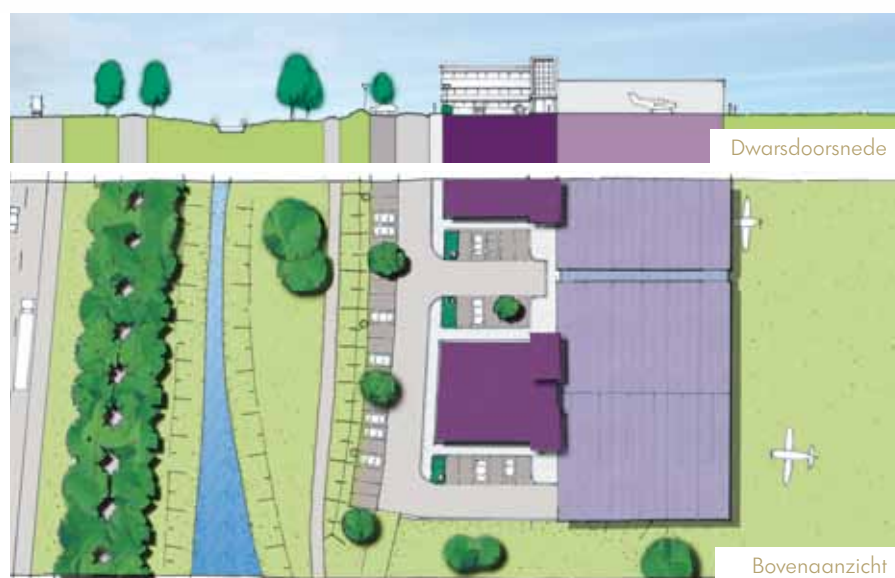
Voorbeelduitwerking Seppe Airparc

De bedoeling is dat zich op het vliegveld veel verschillende soorten bedrijven zullen vestigen. In de afgelopen periode hebben veel bedrijven zich gemeld voor een plekje op het vliegveld. Deze bedrijven hebben als overeenkomst dat ze zich allemaal op een of andere manier bezig houden met luchtvaart. We hebben nu contact met bedrijven die zich bezig houden met zakelijke vluchten met kleine toestellen, die opleidingen verzorgen of service verlenen aan vliegtuigen. Daarnaast willen we een aparte plek creëren voor de ontvangst van mensen die zakelijk vliegen vanaf Seppe Airport.